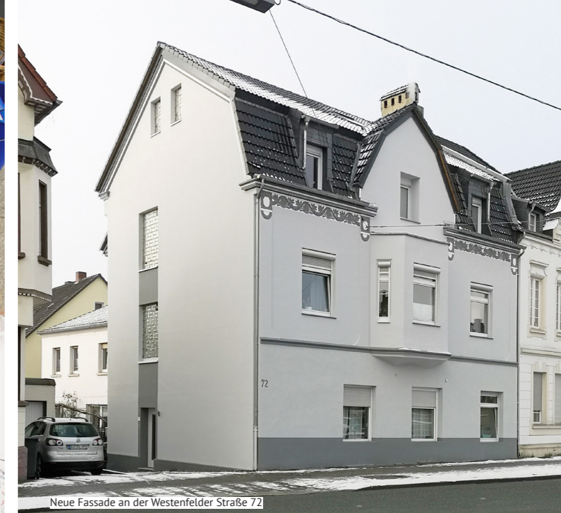
Neue Fassade an der Westenfelder Straße 72

Im Rahmen des Förderprogramms Soziale Stadt – WAT bewegen wurde der Stadtteilfonds eingerichtet, um gemeinnützige Projekte im Fördergebiet Wattenscheid-Mitte finanziell zu unterstützen. Die Projekte kommen dem Stadtteil und den Bewohnenden zugute und können von engagierten Gruppen, Vereinen oder Einzelpersonen beantragt und umgesetzt werden. Die nächste Beiratssitzung findet im Juni statt. Dafür können Anträge bis Ende April beim Stadtteilmanagement eingereicht werden, welches unterstützend zur Seite steht.