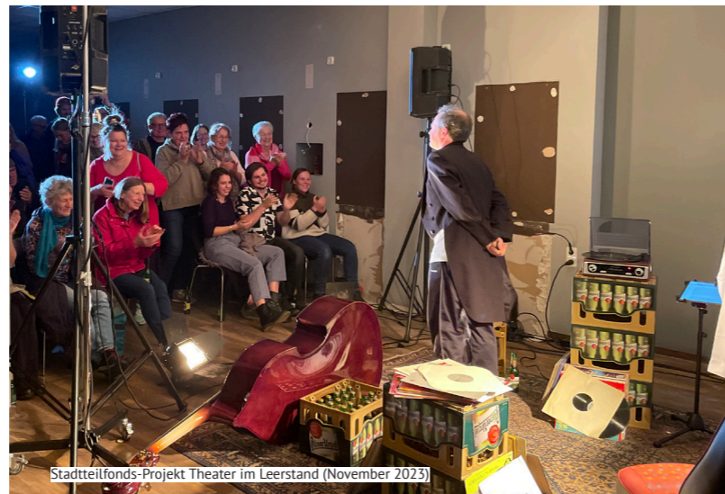
Stadtteilfonds-Projekt Theater im Leerstand (November 2023)

„Hier blüht WAT“ möchte mehr Grün in die Straßen von Wattenscheid-Mitte bringen und zumindest einen kleinen Beitrag zum Umweltschutz leisten. Dazu wurde die Bewohnerschaft aufgerufen, Beetpatenschaften von Straßenbäumen zu übernehmen. Alle Interessierten werden vom Stadtteilmanagement bei der Organisation und mit einem Starterkit für die Erstbepflanzung unterstützt.